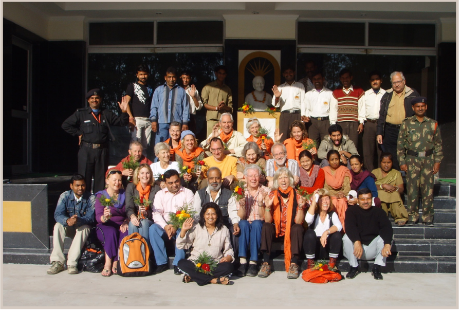
Studenten bij het Prakash Deep Institute of Ayurvedic Sciences